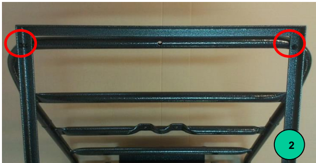
Abb. 2: Befestigungslöcher des Aufbaus für Kisten im oberen Stützteil von Schweizer Karreaufbau

Die Position der 6 Löcher über die Löcher im Rahmen des Aufbaus sichtbar markieren. Die Löcher mit einem Bohrer mit 5,5 mm Durchmesser bohren und entgraten. Den Aufbau mit Mokař mit Schrauben verbinden und mit einer Unterlegscheibe und einer Mutter sichern.