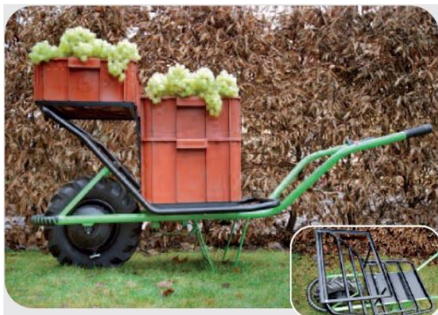
Aufbau für Kisten – Komplettsset

Die Kisten werden in die Konstruktion eingesetzt und es besteht keine Gefahr, dass sie während des Transports vom Schweizer Karreaufbau abrutschen.