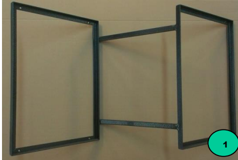
Abb. 1: Aufbau für Kisten – geliefertes Komplettsset Den Aufbau an Schweizer Karreaufbau

Die Position der 6 Löcher über die Löcher im Rahmen des Aufbaus sichtbar markieren. Die Löcher mit einem Bohrer mit 5,5 mm Durchmesser bohren und entgraten. Den Aufbau mit Mokař mit Schrauben verbinden und mit einer Unterlegscheibe und einer Mutter sichern.